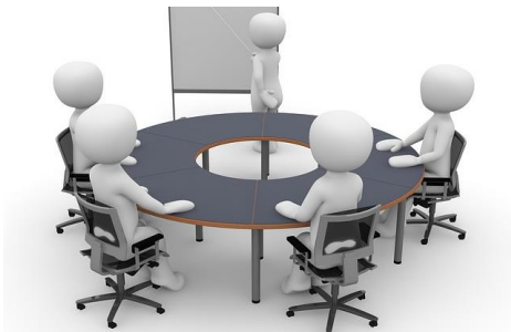
4 rencontres du CA