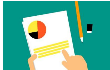
Révision de la grille salariale et de la politique d'octroi de bonus aux employés