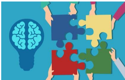
1 lac à l'épaule afin de prioriser les actions de la ZIP