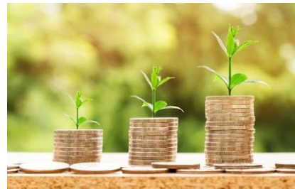
Implication financière pour deux projets pour l'année à venir